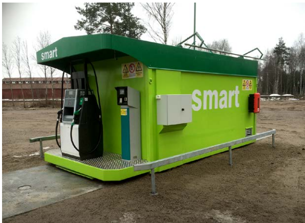
Styrelsen har i juni månad undertecknat ett viktigt avtal om förvärv av Smart Energy Sweden Fuels AB.

Så till det viktigaste av allt, förvärvet av Smart Energy Fuels AB. Det påverkar naturligtvis bolaget mycket positivt och skapar helt nya förutsättningar. Caucasus blir unikt på marknaden med allt ifrån prospektering, produktion till distribution och försäljning av petroleumbaserade bränslen! Se ovan punkten "Viktiga händelser efter periodens utgång" samt pressmeddelandet 2015-06-08.