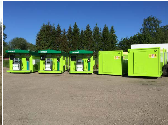
Här står färdiga Smart-stationer klara för leverans!